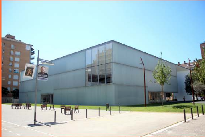
seu actual c/Emili Grahit