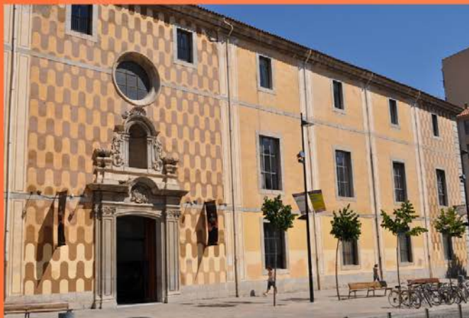
casa de cultura de Girona